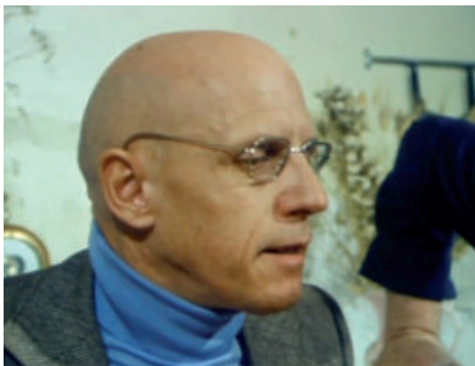
Michel Foucault par lui-même de Philippe Calderon

Le dialogue de la philosophie et du cinéma est à la mode. On ne compte plus les publications tant en français qu'en anglais qui prétendent penser avec le cinéma ou philosopher dans l'image. Pourtant, cet enthousiasme est massivement dominé par une attitude qui consiste à chercher dans les films des illustrations de thèses philosophiques : on retrouvera la Caverne de Platon dans la "Matrice" des frères Wachowski ( Matrix ), ou la psychanalyse de Lacan dans les angoisses de Hitchcock. Si le jeu peut avoir des vertus distrayantes ou pédagogiques, on voit mal ce qu'il peut apporter de vraiment nouveau : les aspects proprement filmiques sont négligés au profit de la narration et le lecteur de Platon sait d'avance qu'il n'en apprendra pas plus en allant s'enfermer dans les salles obscures. Peut-on faire mieux ? Peut-être.