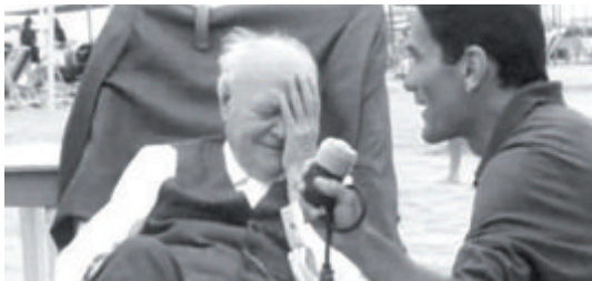
Comizi d'amore de Pier Paolo Pasolini

Il faut en effet se rappeler que Foucault cherchait avant tout une autre manière de faire de l'histoire, une histoire qui, sans se soumettre à la linéarité d'une narration, tiendrait quand même à mettre en évidence des événements. Il s'agissait après tout de