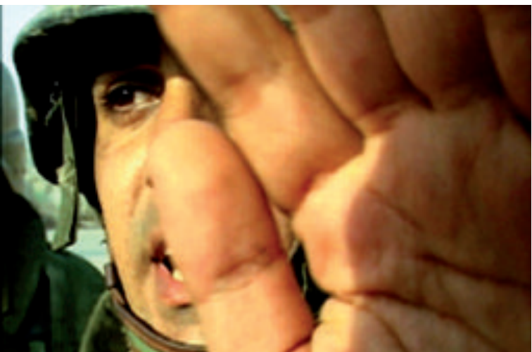
Pour un seul de mes deux yeux de Avi Mograbi

démarche permet d'investir pour ceux qui interrogent l'image cinématographique, ses composantes, son évolution, ses mutations. Comment, par exemple, faire usage du concept d'archive dans le cadre de l'analyse filmique ? Que devient, aussi, l'histoire du cinéma comme objet d'étude, dès lors qu'elle est abordée avec les outils de l'auteur de Naissance de la clinique ? En quel sens, par ailleurs, les descriptions foucaldiennes qui accompagnent l'analyse des pouvoirs disciplinaires rencontrent-elles les méthodes de description de l'image en mouvement (et de ses transformations) ? De quelle manière, en outre, la critique de la mode "rétro" au cinéma dans les années 1970 permet-elle de relancer les interrogations portant aujourd'hui sur les façons de reconstituer l'histoire au cinéma, par-delà les facilités de l'approche thématique ? Autant de questions qui, avec d'autres, guideront les interventions qui accompagneront la programmation filmique.